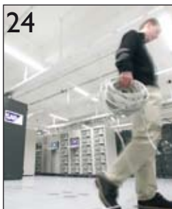
24 Die Gründe für eine Migration auf SAP ERP 6.0 sind verschieden – die Erfahrungen auch: Vier Anwender berichten.