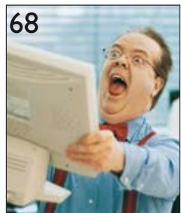
68 Sind Anwender erfreut oder entsetzt über ihre Business-Intelligence- Lösungen? Der BI-Survey verrät es.