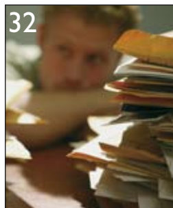
32 Moderne Software für Enterprise Content Management integriert In- formationswelten auf dem Bildschirm der Anwender.